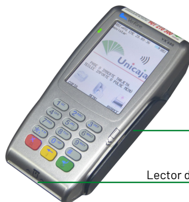
Lector de banda

Es un terminal de tecnología WIFI, que aprovecha el router ADSL del establecimiento, donde se conecta un router neutro, emparejado con el terminal. Esto da movilidad al equipo, siempre que se encuentre en el radio de acción del router.