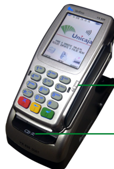
Lector de banda

Es un equipo fijo que puede conectarse tanto a la línea telefónica como al router ADSL del comercio, por ethernet. Al ser modular, facilita al comercio el trabajo en mostradores con características especiales, como son las mamparas de seguridad.